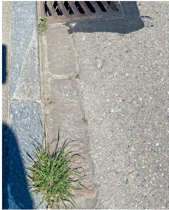
Diverse Randstein-Abschnitte, Zustand „Vorher“