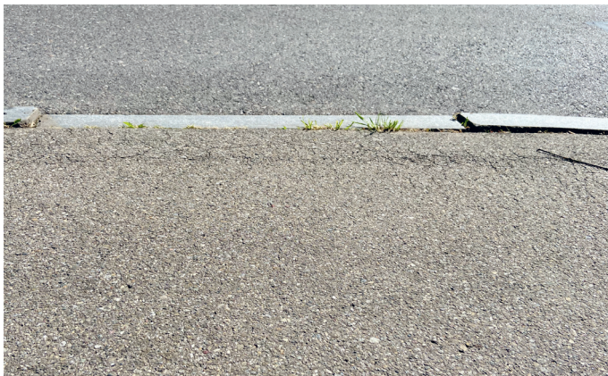
Diverse Randstein-Abschnitte, Zustand „Vorher“